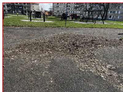
FOTO č. 3 asfaltová plocha