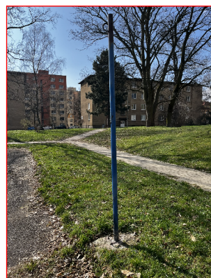
FOTO č. 5 sloupky na volejbal