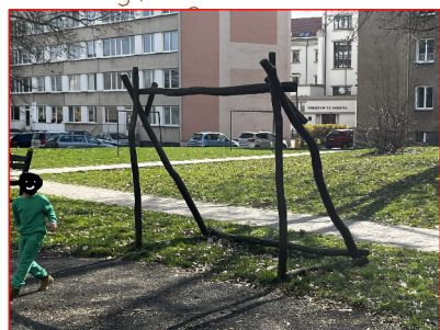
FOTO č. 1 branka jižní