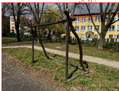
FOTO č. 2 branka severní