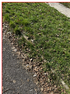
FOTO č. 4 obrubník